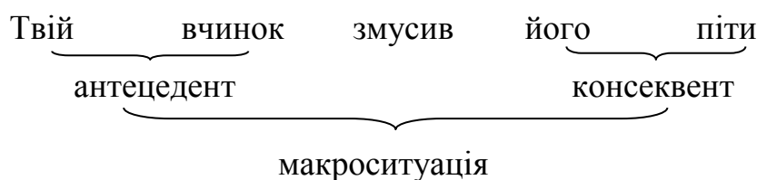
Схема 1.1 Базова каузативна ситуація (КС)

За визначенням В. П. Неद्याлкова та Г. Г. Сильницького, каузативною є ситуація, що складається мінімум із двох мікроситуацій, пов'язаних між собою відношенням каузації або спричинення. Каузувальна ситуація називається антецедентом , а ситуація, яка каузується – консеквентом [215, с. 6; 272, с. 9–11].