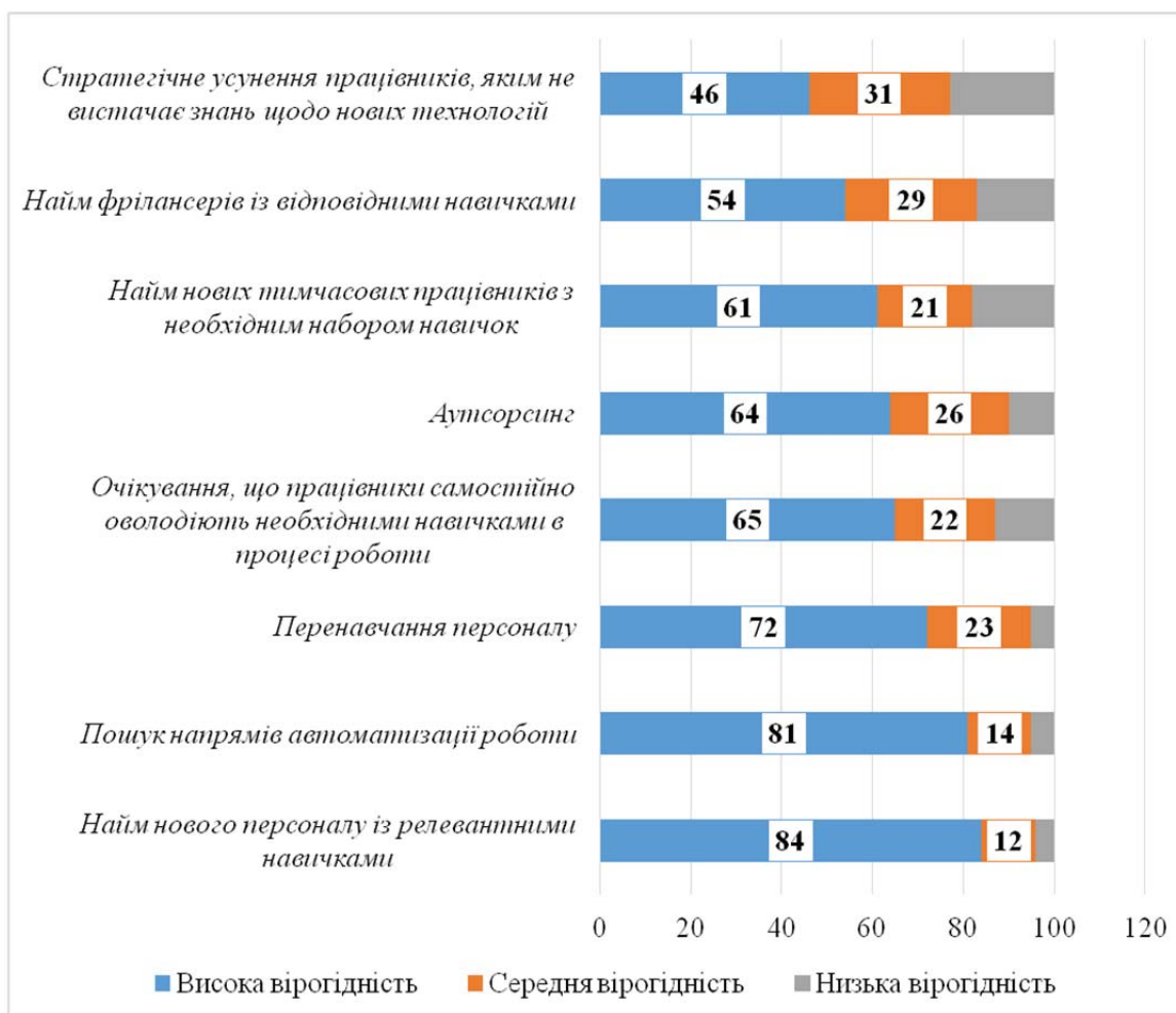
Рис. 1. Напрями подолання розриву між наявними і затребуваними навичками з боку роботодавців 2