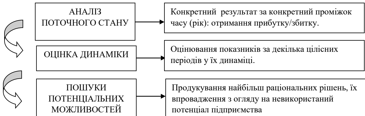
Рисунок 1- Складові процесу дослідження стану підприємства побудовано автором

Широковідомий факт, основною метою будь-якого комерційного підприємства є Прибуток виступає одним з показників ефективності підприємства за конкретний період часу. Проте для отримання більш повної картини розвитку ефективності діяльності підприємства необхідним є інформація у динаміці. У таблиці 2 представлені показники декількох газорозподільних підприємств України, які характеризують результат їх основної діяльності – постачання та транспортування газу, а також фінансовий результат до оподаткування як та стаття, що характеризує прикінцевий результат діяльності підприємства.