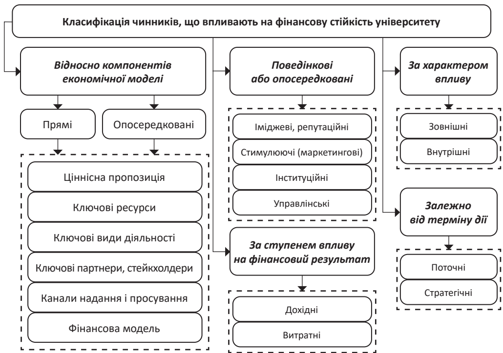
Рис. 1. Класифікація чинників фінансової стійкості університету

Фінансова стійкість університету досліджується крізь призму кількісних і якісних показників, що зумовлено новою парадигмою вищої освіти, драйверами трансформаційних процесів. Скорочення бюджетного фінансування є викликом для державних університетів та вимагає зміни підходів до управління, у т. ч. фінансами. Визначення чинників фінансової стійкості ґрунтується на ціннісному підході, який покладено в основу економічної моделі університету [8]. Ідентифікацію чинників відповідно до класифікаційних ознак відображено на рис. 1.