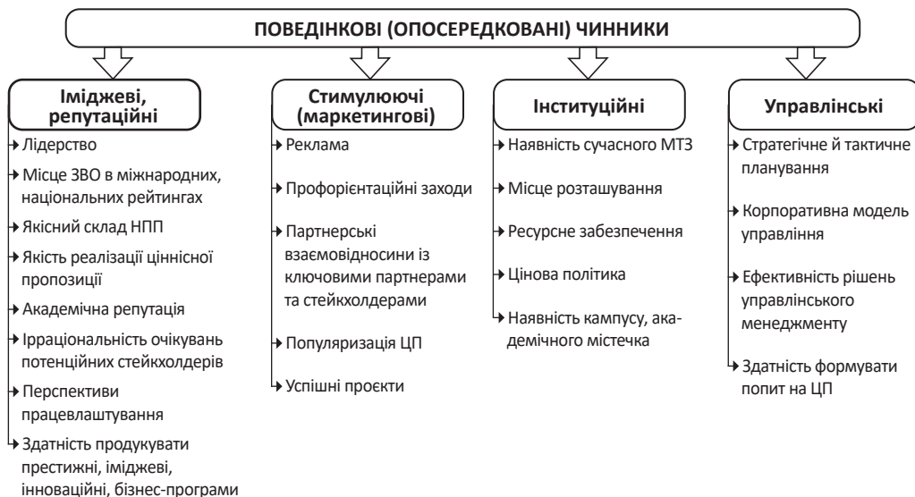
Рис. 3. Поведінкові (опосередковані) чинники фінансової стійкості університету

1) іміджеві, репутаційні: лідерство, місце ЗВО в міжнародних і національних рейтингах, якісний склад