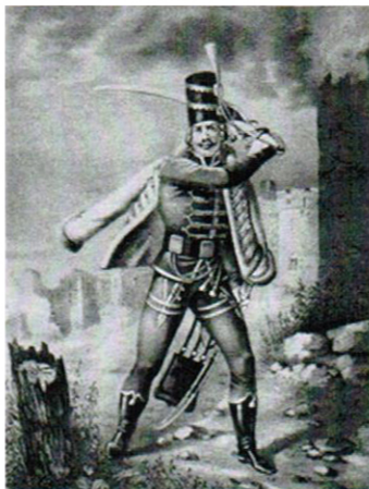
Рядовий Бахмутського гусарського полку

Б.к.к.п. ніс службу у південному прикордонні Російської імперії. Щоденно виділялося 60 козаків для охорони кріпосних валів і глибокої розвідки татарських чамбулів. Також козаки несли сторожову службу на заставах – Корсунському і Кривецькому буераках, на Товстій могилі, у Залізній балці, в гирлах Грузької та Казенного Торця, об'їжджали заповідні ліси, охороняли купців, козацькі табуни і пошту, супроводжували державних чиновників, здійснювали розвідки «воровських партій», розшукували несанкціоновану сіль, описували слободи, несли караули в полковій канцелярії,