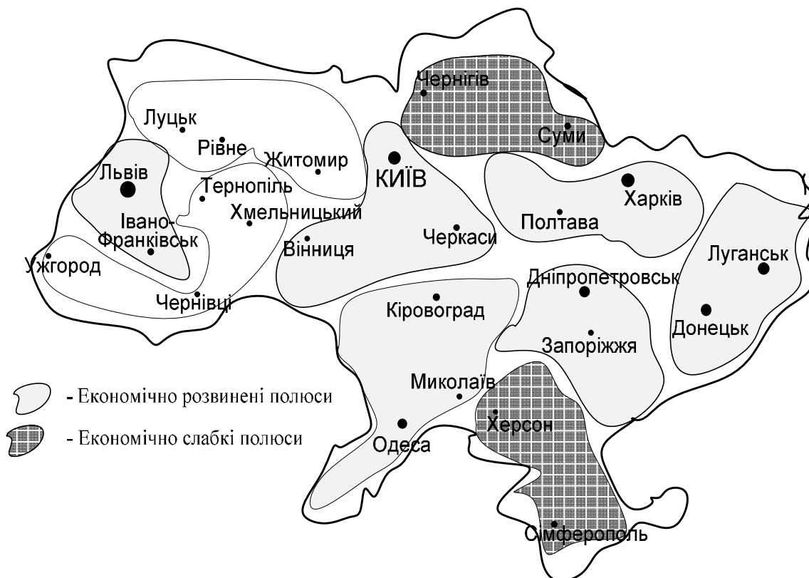
Рис. 2. Економічна полюсність регіонів України

Мобільні чинники. У цій групі чинників пріоритетне місце відводимо міграції населення, яке, залежно від традицій, звичного способу життя та місця проживання у різних регіонах має до неї різну схильність. В цілому мобільність праці і капіталу між регіонами не однакова, хоча на фоні глобалізаційних процесів обмеження на рух грошових потоків і населення поступово стираються. В межах однієї країни регіональні бар'єри руху факторів виробництва знижуються за рахунок єдиної мови і культури, менших формальних обмежень на міграцію, торгівлю і рух капіталу. У регіонах спостерігається чітко виражена полюсність, яка прямо пов'язана з ринком праці і, в певній мірі, є демонстрацією дії закону Рейлі. Його суть в тому, що біля регіону з розвинутою економікою розташовуються також доволі міцні з фінансово-економічного погляду території. Так, економічно розвинені м. Київ і Київська область (5,2 % ВРП у 2015-2016 рр.) певною мірою формують потенціал сусідніх областей, до яких належать Черкаська (2,6 % ВРП) і Вінницька області (3,0 % ВРП), чи, наприклад, значно слабша Хмельницька область (2,0 % ВРП) оточена такими ж слабкими: Тернопільською (1,3 % ВРП), Рівненською (1,7 % ВРП) та Волинською (1,6 % ВРП) областями [9] (рис. 2).