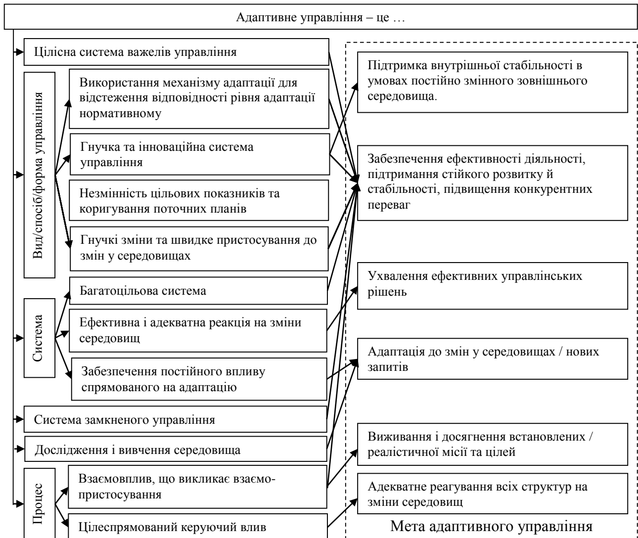
Рис. 1. Морфологічний аналіз поняття «адаптивне управління»

дослідження інваріантного визначення цього поняття. Застосування міждисциплінарного підходу та морфологічного аналізу широкого кола трактувань дефініції «адаптивне управління» дозволило виділити декілька основних підходів та особливостей (рис. 1).