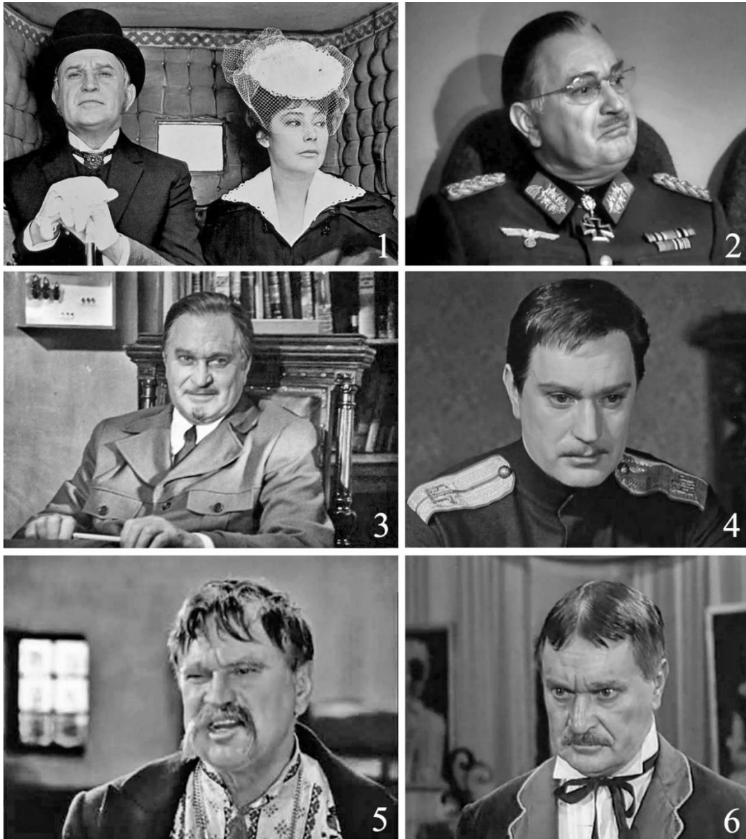
Рис. 1 – Микола Олімпійович Гриценко в кіноролях: 1 – Олексій Олександрович Каренін, «Анна Кареніна» (1967); 2 – німецький генерал у поїзді, «Сімнадцять митей весни» (1973); 3 – Микола Антонович Татаринів, «Два капітани» (1976); 4 – Вадим Петрович Рошин, «Ходіння по муках» (1959); 5 – старшина Василь Миронович, «Веселі Жабокричі» (1971); 6 – Вікентій Павлович Сперанський, «Ад'ютант його вельможності» (1969)

Миколі Гриценку присвячено серію нарисів у періодичних і тематичних виданнях про театр і кіно, його персоналії можна знайти у багатьох довідково-енциклопедичних виданнях різних країн. До 100-річчя актора побачили світ дві книги, одна з яких написана колегами по Вахтангівському театру [1], а друга підготовлена музейними співробітниками з його малої батьківщини [16]. Під час краєзнавчих розвідок нашу увагу в цьому масиві публікацій привернула та обставина, що деяка інформація з них, зокрема біографічного характеру, не відповідає історичній істині або є неточною. Саме це спонукувало автора підготу-