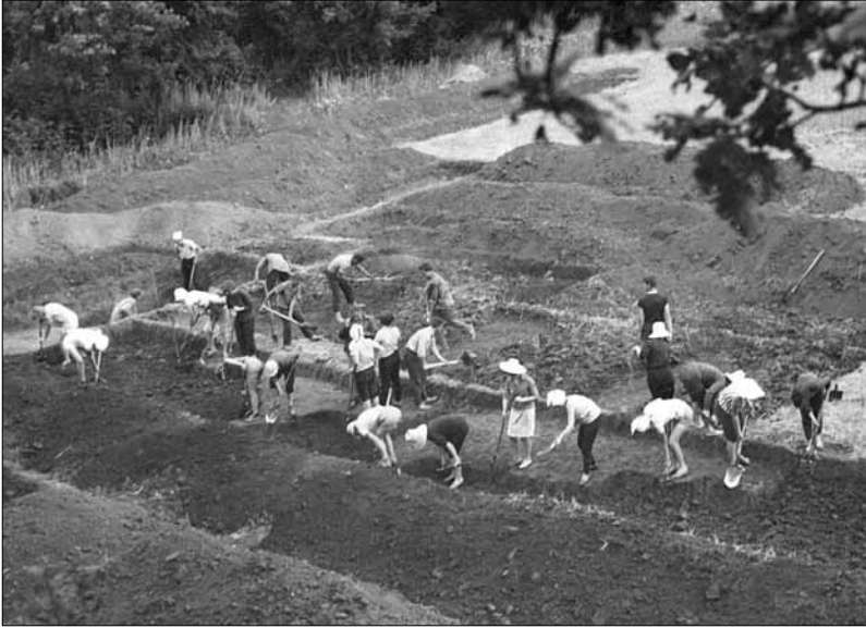
Розкоп I на Східному Більському городищі. 1959 р.