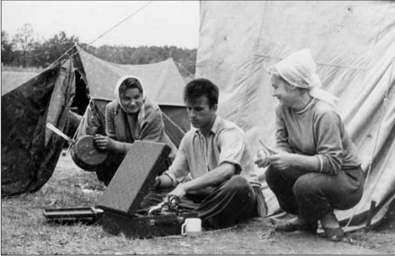
Музична пауза на Більському городищі. 1960 р.

віків та залишився на цій посаді після завершення в 1962 р. університетського навчання, а від вересня 1964 р. до листопада 1970 р. був завідувачем Археологічного музею Харківського державного університету.