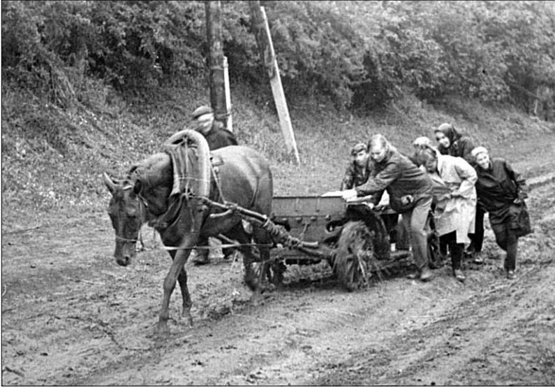
Транспортний засіб на Більському городищі, Сумська обл. 1970 р. Розвідка на Куземинське городище.