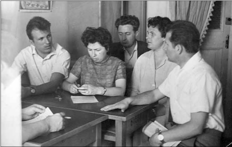
На засіданні кафедри археології та історії стародавнього світу Харківського державного університету. 1970 р.

ник продовжував багато, глибоко і наполегливо працювати. Причому не лише з археологічними джерелами. Зокрема, чимало зусиль було докладено до історико-лінгвістичних студій, які не лише дозволили науковцеві виявити раніше невідомі зв'язки, а й суттєво посилити систему аргументації основних положень. Первинне дослідницьке завдання, пов'язане із вивченням хронології поселення Пожарна Балка, поступово набуло масштабності й переросло у дослідження проблем хронології раннього залізного віку Євразії, через що довелося занурюватися не лише у проблематику величезного скіфського світу, а й у хронологію Ассирії, Урарту, Фрігії, Греції тощо. Паралельно із цим основним напрямом Владислав Петрович, така вже його натура, не полишав кілька інших своїх інтересів, зокрема, давнє мистецтво, культури, знакові та писемні системи, структурно-семіотичний аналіз артефактів, в рамках яких свого часу опублікував низку цікавих і, попри стислий обсяг, важливих праць [4–10].