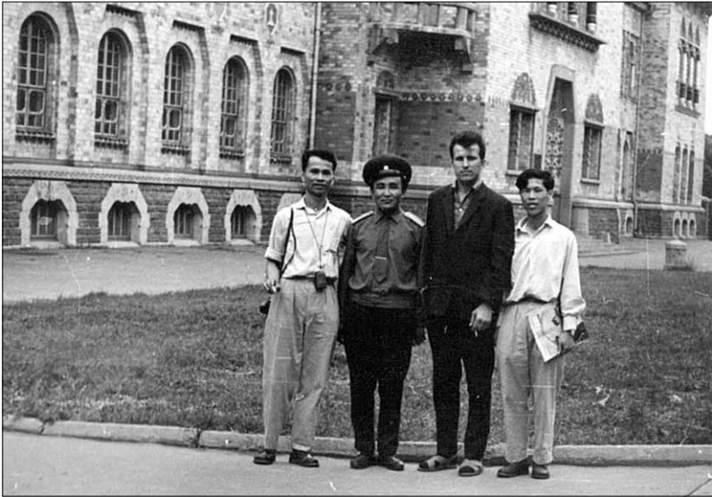
Біля Полтавського краєзнавчого музею. 1965 р. З в'єтнамськими студентами і монгольським офіцером-курсантом.