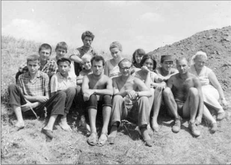
На Західному укріпленні Більського городища, Полтавська обл. 1966 р.