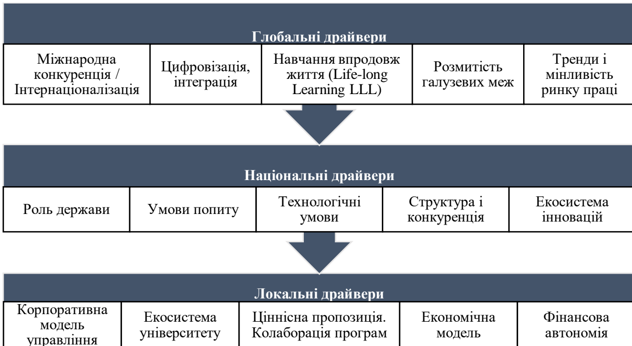
Рисунок 1 – Драйвери, що визначають нову парадигму вищої освіти *розроблено автором на основі [1, 2, 3]

Тенденції розвитку і ключові мотиви функціонування університетів за нової парадигми вищої освіти визначається драйверами (рис. 1), що впливають на визначення стратегічних напрямків розвитку університетів. Систематизація драйверів за рівнем впливу на розвиток вищої освіти дозволила виділити три рівні: глобальний, національний і локальний.