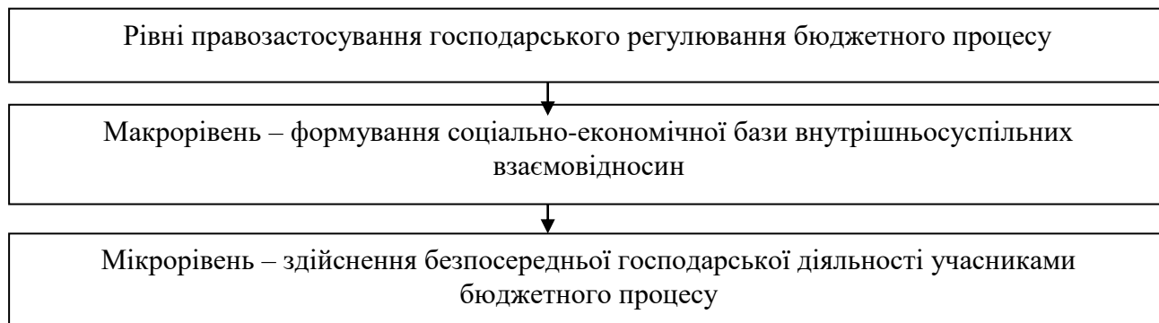
Рис 1. Рівні правозастосування господарського регулювання бюджетного процесу [авторська розробка]

бюджету має прикладний, процесний характер, оскільки відбувається за допомогою регулювання законів і підзаконних актів, спеціальних актів і є механізмом втілення стратегічної мети, визначеної прийнятим бюджетом.