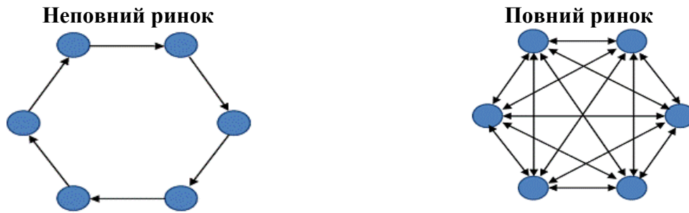
Рис. 1. Повний та неповний ринок міжбанківського кредитування

міжбанківського ринку, вплив кризи на один регіон може бути змінений і тому вплив на інші регіони буде меншим [1].